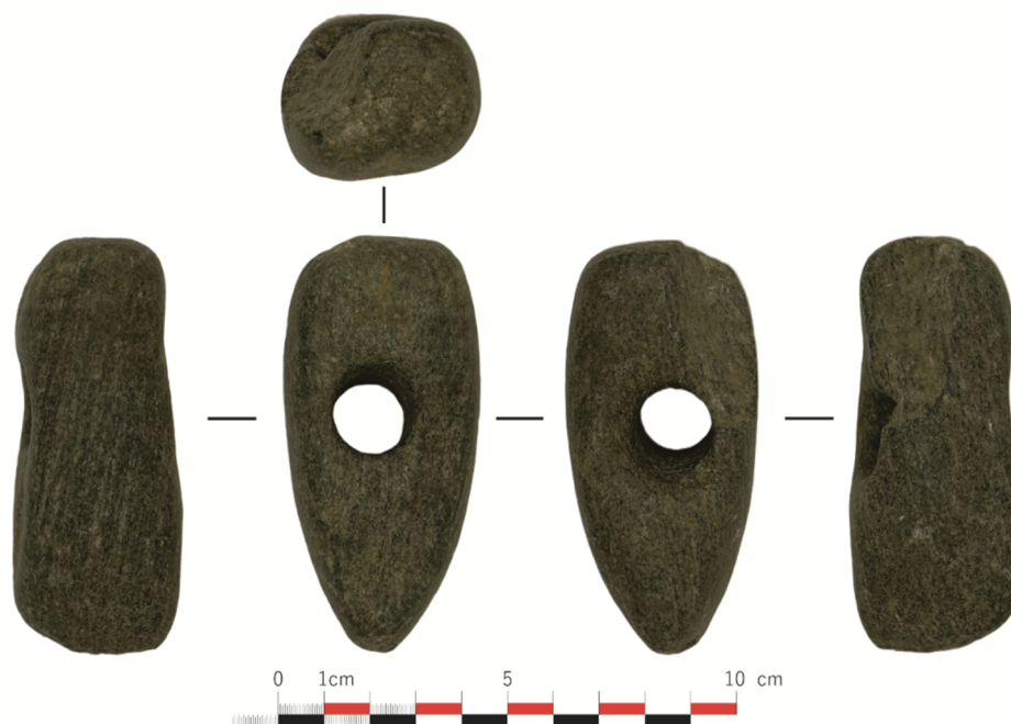
Fig. 3. Topor-ciocan din piatră ridicat de autoritățile judiciare de la Cr.I. în anul 2004. Foto și prelucrare proprie 2021.

Stone axe-hammer seized by the judicial authorities from Cr.I. in the year 2004; photography and personal editing 2021.