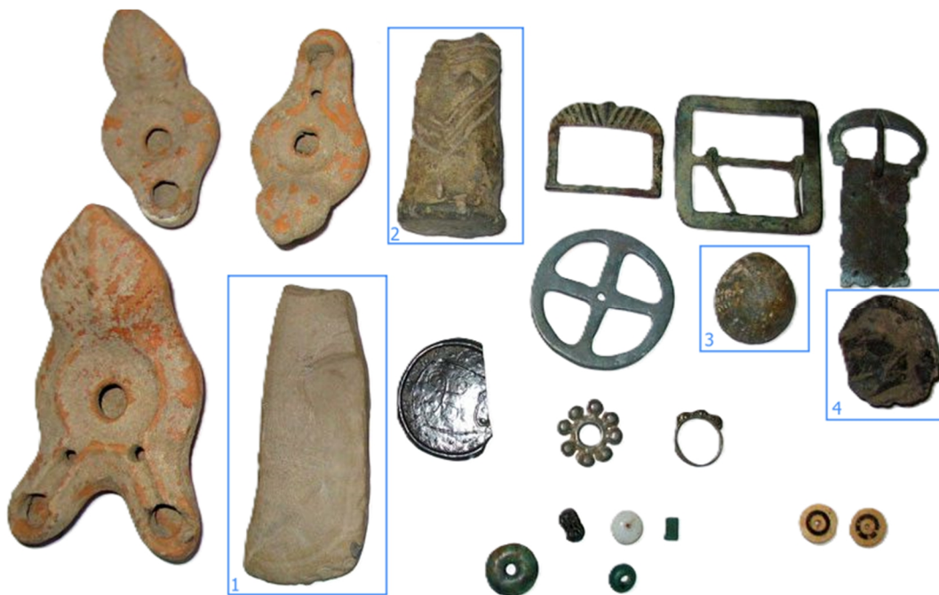
Fig. 2. Artefacte ridicate de la S.N. în anul 2005, apud revista Dacia Magazin (nr. 57/2009), cu prelucrarea proprie a fundalului și marcarea celor utilizate în acest studiu (1 – topor-teslă; 2 – statueta antropomorfă; 3 – fosilă Echinoidea (Clypeaster); 4 – nucleu de silex).

Pottery fragments seized by the judicial authorities from N.I.F. in the year 2000, apud dos. pen. nr. 45/P/2005, vol. III, f. 349.