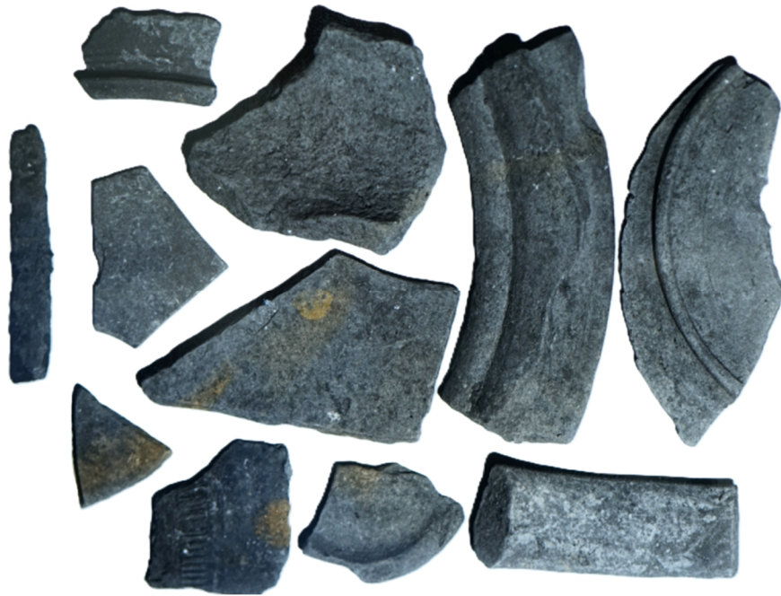
Fig. 1. Fragmente ceramice ridicate de autoritățile judiciare de la N.I.F. în anul 2000, apud dos. pen. nr. 45/P/2005, vol. III, f. 349.

Pottery fragments seized by the judicial authorities from N.I.F. in the year 2000, apud dos. pen. nr. 45/P/2005, vol. III, f. 349.