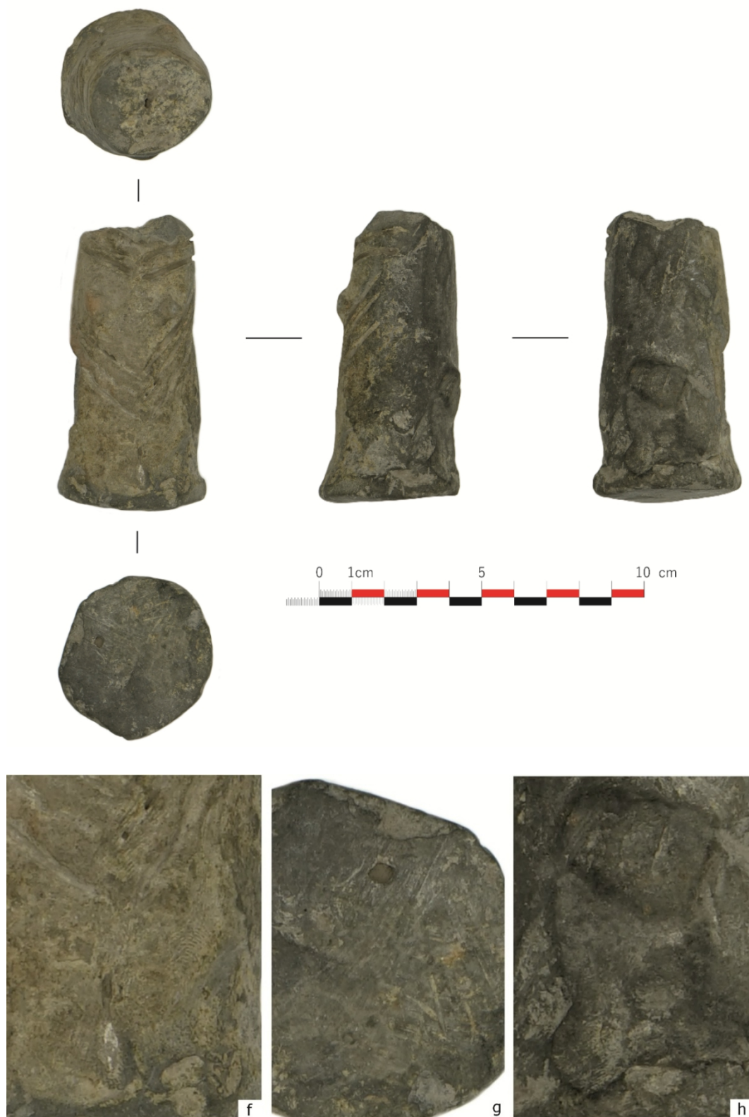
Fig. 6. Statuetă antropomorfă fragmentară ridicată de autoritățile judiciare de la S.N. în anul 2005; f-h – detalii cu amprente papilare și zgârieturi aflate pe suprafața piesei. Foto și prelucrare proprie 2021. Fragmentary anthropomorphic figurine seized by the judicial authorities from S.N. in the year 2005; f-h – details with papillary impressions and scratches on the surface of the artefact; photography and personal editing 2021.