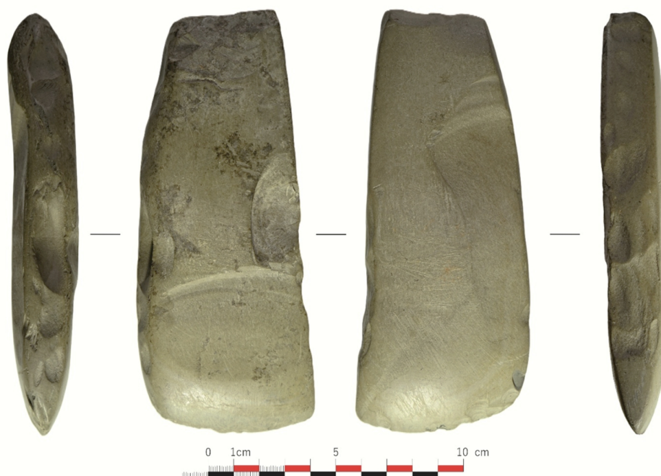
Fig. 4. Topor-teslă din piatră ridicat de autoritățile judiciare de la S.N. în anul 2005. Foto și prelucrare proprie 2021.

Stone axe-hammer seized by the judicial authorities from Cr.I. in the year 2004; photography and personal editing 2021.