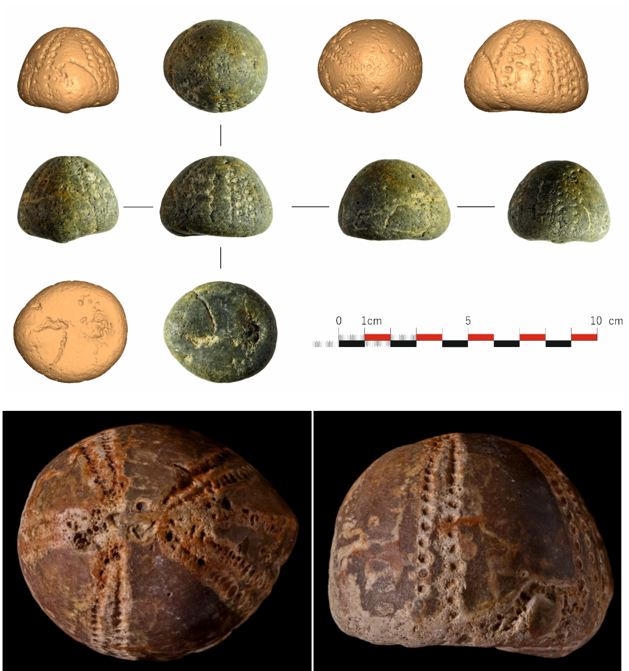
Fig. 5. Fosila – Echinoidea (Clypeaster) ridicată de autoritățile judiciare de la S.N. în anul 2005. analogie apud Birmingham Museums Trust. Fossil – Echinoidea (Clypeaster), seized by the judicial authorities from S.N. in the year 2005; analogy apud Birmingham Museums Trust.