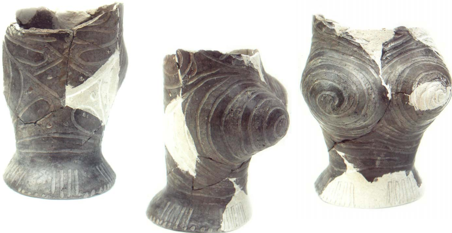
Fig. 2. Statuetă antropomorfă. / Antropomorphical statuete.