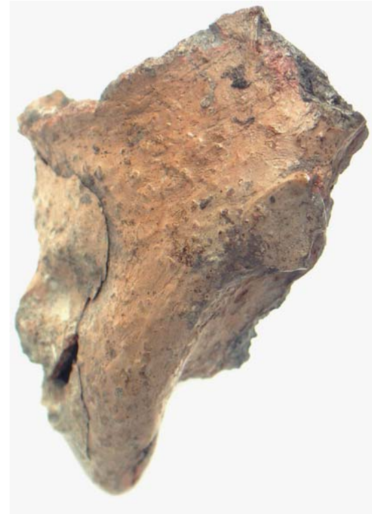
Fig. 4. Protomă antropomorfă. / Anthropomorphical protoma.